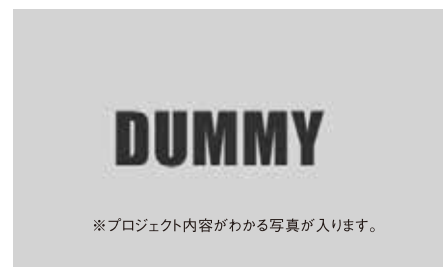
写真のキャプションが入ります

その支援者をゲストに招き、先進事例紹介や意見交換などを行うことで、奈良でソーシャルビジネスに取り組もうとするスタートアップ層を発掘し、参加者どうしの連携を形成することを目的に月一回のペースで開催します。市民「ならソーシャルビジネスカフェ」は、県内外からソーシャルビジネスの先駆者やその支援者をゲストに招き、先進事例紹介や意見交換などを行うことで、奈良でソーシャルビジネスに取り組もうとするスタートアップ層を発掘し、参加者どうしの連携を形成することを目的に月一回のペースで開催します。市民「ならソーシャルビジネスカフェ」は、県内外からソーシャルビジネスの先駆者やその支援者をゲストに招き、先進事例紹介や意見交換などを行うことで、奈良でソーシャルビジネスに取り組もうとするスタートアップ層を発掘し、参加者どうしの連携を形成することを目的に月一回のペースで開催します。市民「ならソーシャルビジネスカフェ」は、県内外からソーシャルビジネスの先駆者やその支援者をゲストに招き、先進事例紹介や意見交換などを行うことで、奈良でソーシャルビジネスに取り組もうとするスタートアップ層を発掘し、参加者どうしの連携を形成することを目的に月一回のペースで開催します。