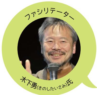
千葉大学大学院園芸学研究科 教授 工学博士(地域計画)

いまの奈良も悪くないけれど、もっと魅力ある奈良、そして将来も住み続けたいと思える奈良に必要なものは？